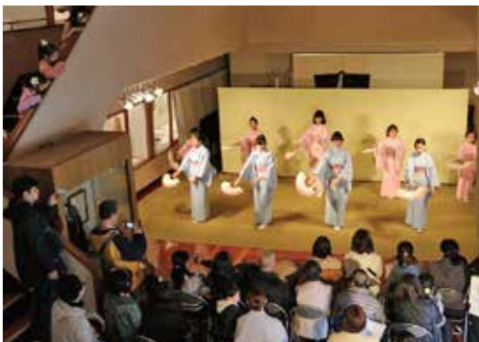
クラブフェスタ2020 発表の部／日本舞踊