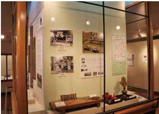
市民の文化活動報告展 「あなたの野田を見つけよう」