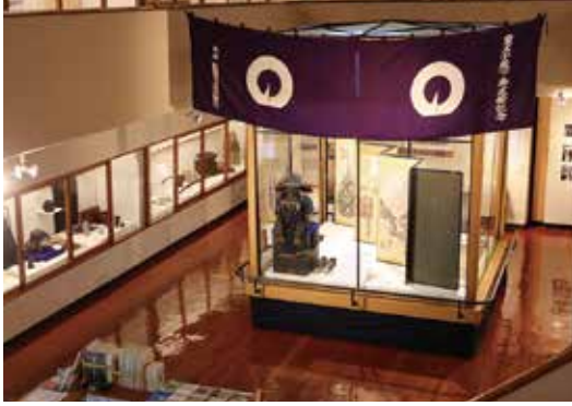
特別展 「郷土史へのまなざし～博物館誕生のものがたり～」