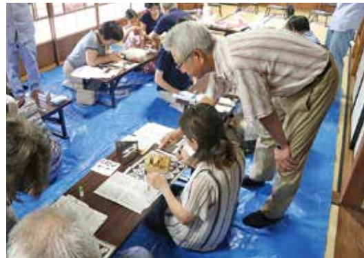
市民の文化活動報告展関連事業 「篆刻を体験してみよう」