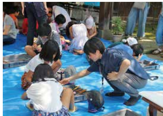
子ども体験教室 「古代のアクセサリー・勾玉をつくろう！」