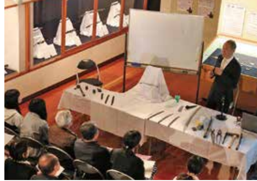
市民コレクション展関連事業 刀剣講演会「日本刀を造る」