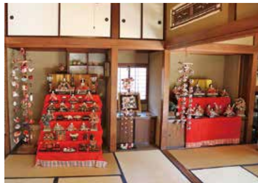
市民グループ「室礼サロン たのしい和」による 市民会館のおひなさま飾りつけ