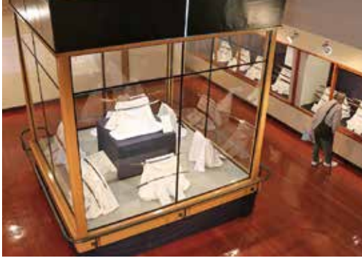
市民コレクション展 「日本刀～古刀から現代刀まで～」