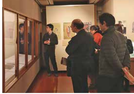
特別展 学芸員による展示解説