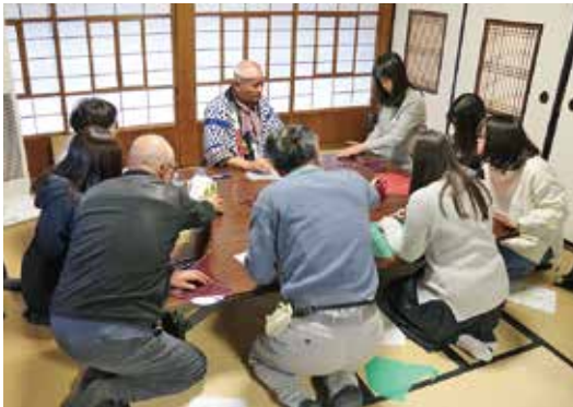
寺子屋講座・芸道文化講座 「凧に魅せられて～世界の中の日本の凧～」