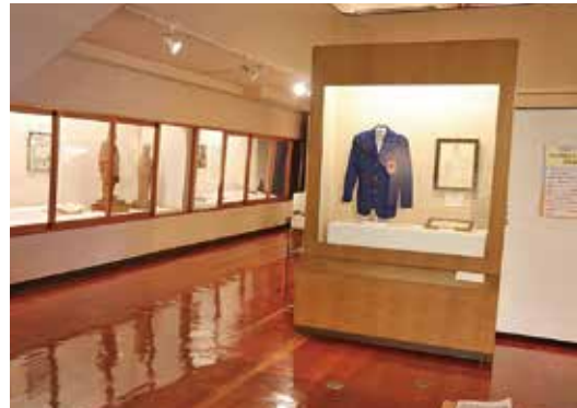
企画展 「野田に生きた人々 その生活と文化 2020」