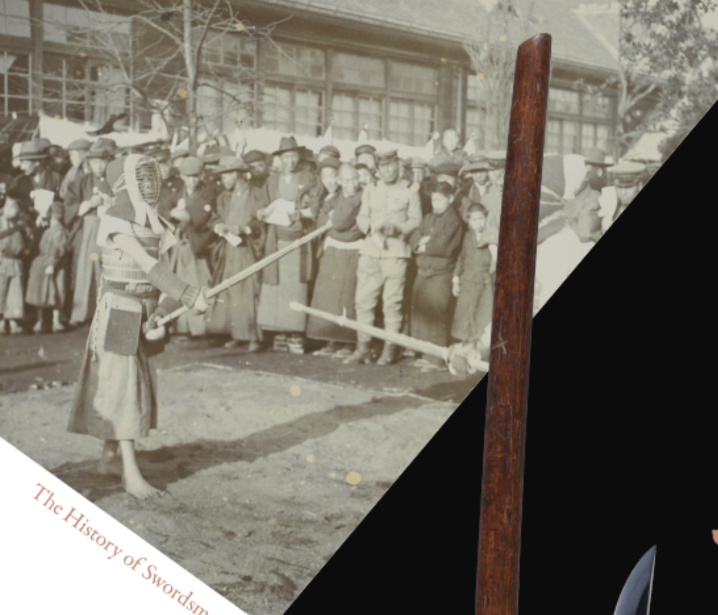
The History of Swordsmanship and Kendo in Noda