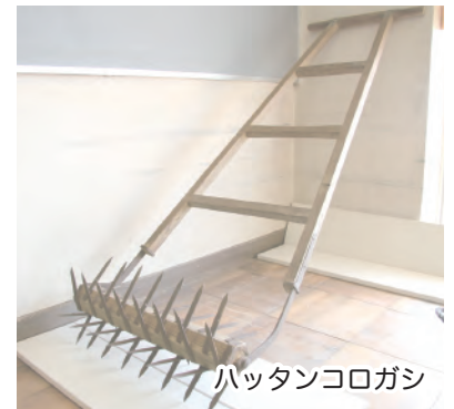
ハッタンコロガシ